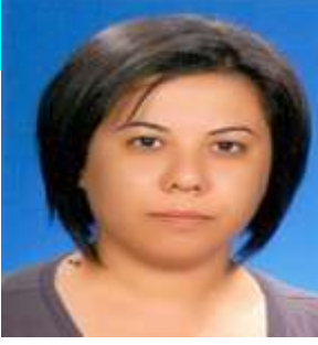
Sultan K. GÜL-Rehberlik Toplam Yazı Adedi:1