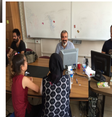
MEHMET ADİL İKİZ ORTAOKULU TEOG KOMİSYONU