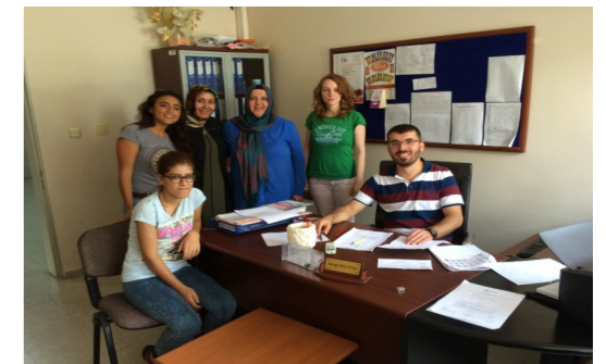
SABANCI AİLESİ İMAM HATİP ORTAOKULU TEOG KOMİSYONU