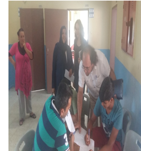
TİCARET BORSASI ORTAOKULU TEOG KOMİSYONU

Sorumluluk alanımızda bulunan okullarımızda TEOG tercih komisyonlarına yaptığımız ziyaretlerimizde komisyonlarda görevli arkadaşlarımızın oldukça özverili ve gayretli biçimde çalıştıklarını görmekten dolayı Yüreğir Ram ailesi olarak teşekkür ederiz.