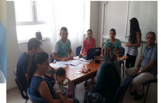
KILIÇARSLAN ORTAOKULU TEOG KOMİSYONU