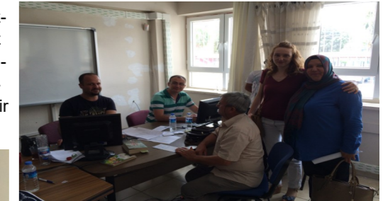
MEHMET ADİL İKİZ ORTAOKULU TEOG KOMİSYONU