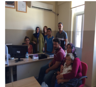
TOKİ OSMAN GAZİ İMAM HATİP ORTAOKULU TEOG KOMİSYONU